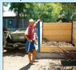
Compartimente din lemn pentru compost

Acest tip de facilități de stocare este modular, astfel dimensiunea și numărul compartimentelor pot fi modificate în funcție de nevoi.