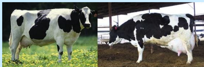
NORMAL GRASS FED COW

- administrarea în scopuri terapeutice sau zootehnice a testosteronului, progesteronului precum și a derivaților acestora precum și a substanțelor betaagoniste se efectuează numai de către sau sub responsabilitatea directă a unui medic veterinar care va consemna tratamentul efectuat în registrul de consultații și tratamente;