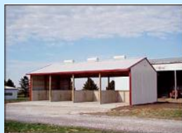
Adăposturi din beton de dimensiuni medii